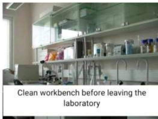
Clean workbench before leaving the laboratory